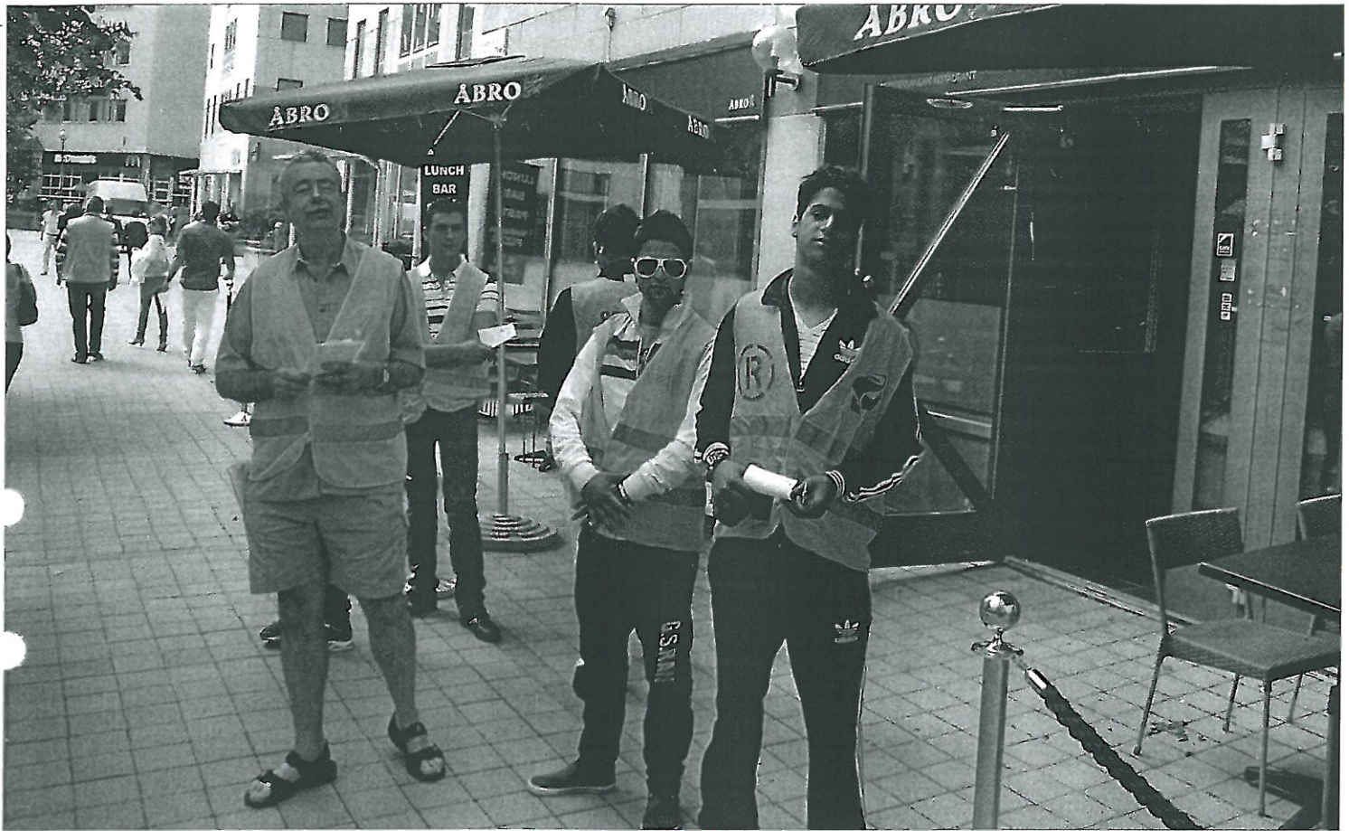
Västerorts LS backar inte för att ta strid för sina medlemmar, inte ens om maffian är inblandad