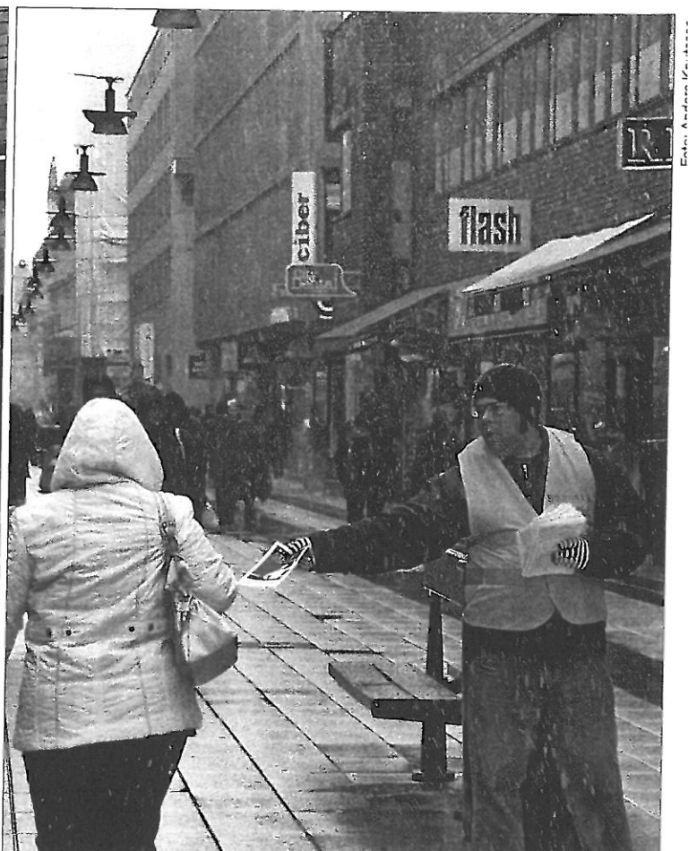
En av de berörda lärarna i Stockholm i snöyan utanför SiS huvudkontor

Det är värt att nämna att det inom lärarkåren i Sverige råder en mycket hög fackanslutningsgrad. Missnöjet är dock lika utbrett. Under avtalsrörelsen förra året var strejkviljan hos gräsrotterna stor. År efter år med försämringar och neddragningar där mer och mer läggs på arbetsbördan och inget dras ifrån har retat upp lärarkåren rejält. Många vill, eller har redan valt, att lämna yrket. Men lärarfacken är fortsatt passiva i praktiken.