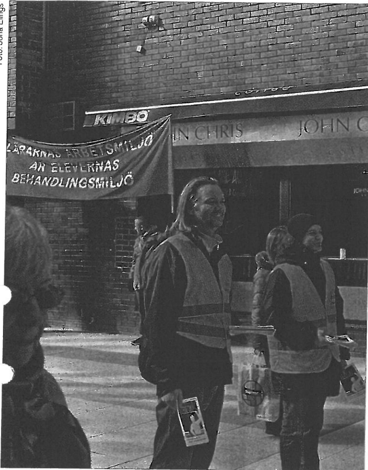
Stockholms LS delar ut stödflygblad utanför SiS på Drottninggatan