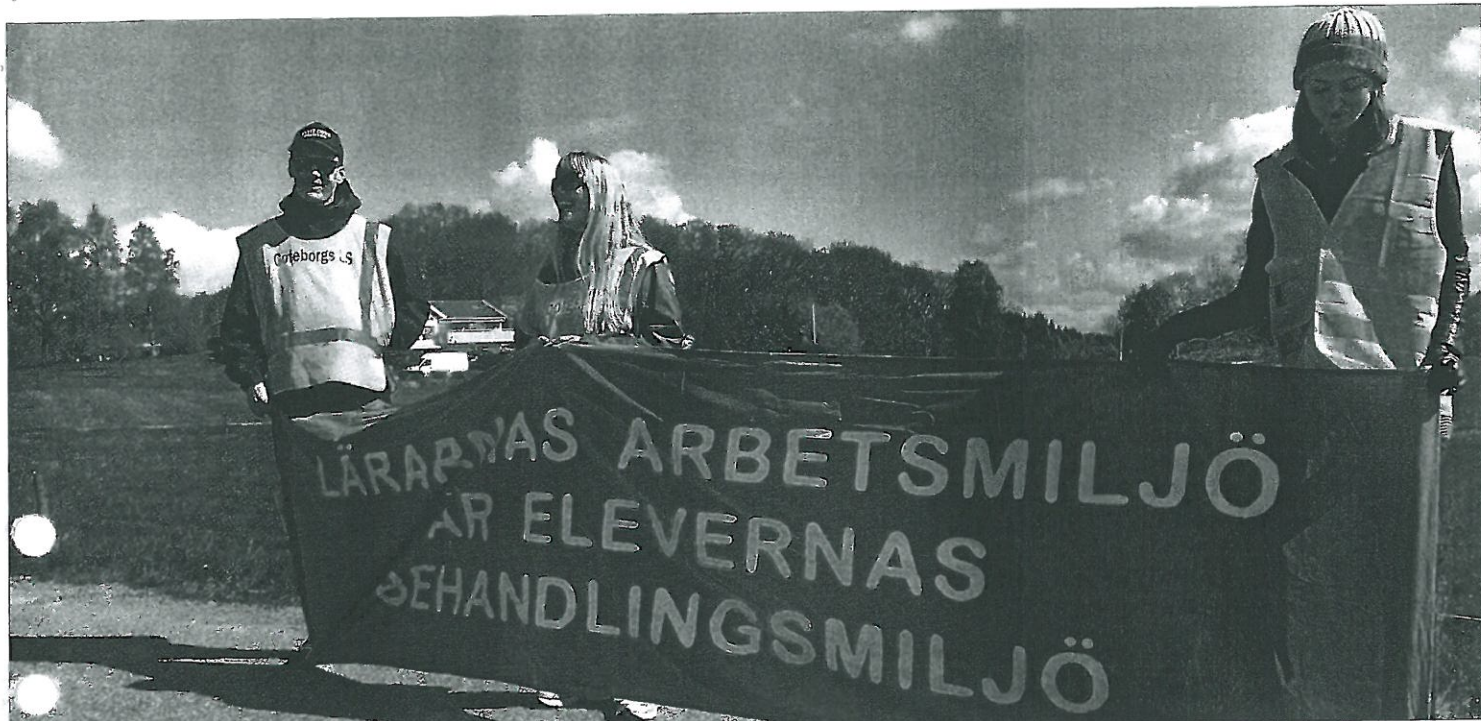
Försämringarna av lärarnas arbetsvillkor påverkar elevernas situation. Ingen vinner på Björkbackens besparingsiver