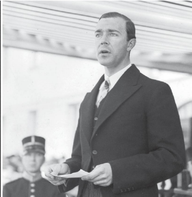
Överst från vänster: Utrikesminister Christian Günther, finansminister Ernst Wigforss, diplomaten Raoul Wallenberg samt arvprins Gustaf Adolf.