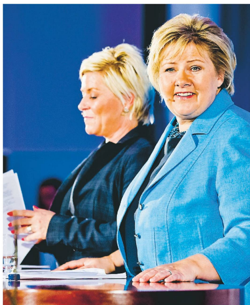
Fremskrittspartiets Siv Jensen (i bakgrunden) och Høyreledaren Erna Solberg.