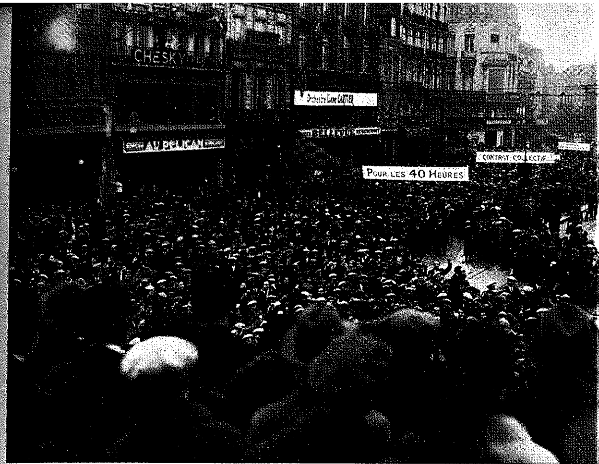
Från det fackliga genombrottet i Frankrike

Den syndikalistiska aktivismen och handlingskulten kombineras hos de berörda författarna med en speciell, om också föga utformad historiefuppfattning. Den marxistiska historiefilosofin med dess fasta schema för utvecklingen, dess bestämda förutsägelser avvisas; den säges innebära en underskattning av den mänskliga viljans, av idealbildningens förmåga till självständigt nyskapande. Klasskampen är, anser man, icke med nödvändighet den grundläggande faktor som Marx föreställde sig; detta framgår av socialdemokratins utveckling till kompromisspolitik. Då syndikalismen vill giva klasskampstanken ny styrka anknyter den visserligen till Marx, men i motsats till Marx framställer man klasskampen såsom väsentligen orsakad av en "fri" idealbildning. Marx kompletteras sålunda med Bergson; syndikalismen och klasskampen bli led i "den