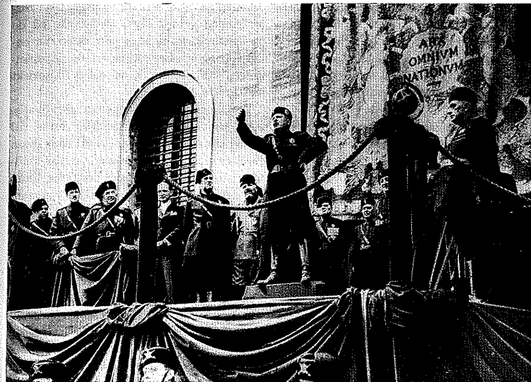
Overfascisten i färd med att plagiera Sorel

Fascismens kritik av demokratin har väsentliga drag gemensamma med syndikalismens. Tonvikten lägges icke såsom i traditionell konservatism på den risk det demokratiska systemet innebär för de privilegierade socialklasserna, utan kritiken har en annan och mera principiell inriktning. Man angriper själva det demokratiska systemets utgångspunkter: tanken att genom diskussion komma fram till rationella lösningar, att genom utjämnande och kompromisser nå för det stora flertalet acceptabla resultat. Dels avvisas de rationalistiska förutsättningarna, dels förklaras förhandlingarna och de ömsesidiga eftergifterna vara demoraliserande. Den starkaste riktningen skall segra, och segra helt, den får icke bindas av hänsyn till oliktankande riktningar; toleransen är ett tecken på svaghet och viljan att förstå andra är ett uttryck för bristande fasthet i tron. Till kritiken av demokratin ansluter sig elitteorin. Ledningen skall tillhöra de aktiva, trosvissa och heroiska elementen, som förkasta tanken på fredliga, "demokratiska" uppgörelser. Eliten karakteriseras på väsentligen samma sätt, ehuru den enligt syndikalismen skall föra arbetarklassen till strid, enligt fascismen styra den till en enhet sammansvetsade nationen.