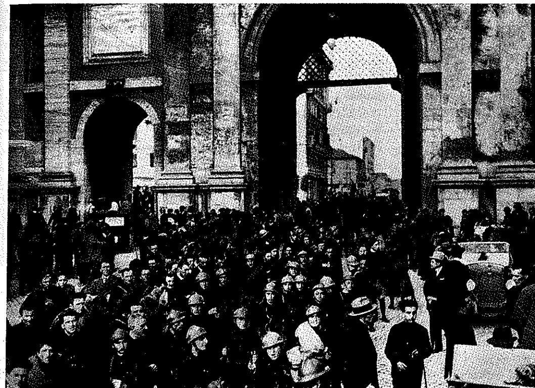
Fascistmarschen till Rom 1922